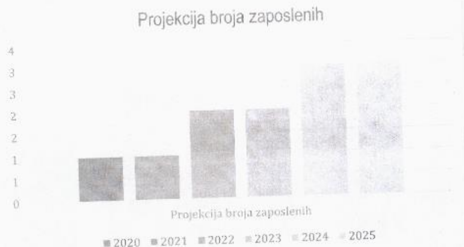
Grafički prikaz: Plan kretanja broja zaposlenih po godinama